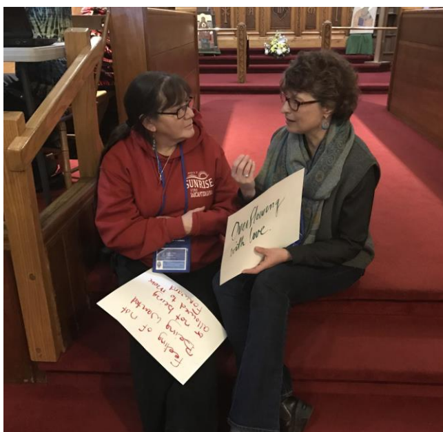
Capacitación de evangelización en EEUU

Los episcopales están reclamando y abrazando el ministerio de la evangelización, y esto está rearmando a la iglesia toda. Al transitar el Camino del Amor y bendecir al mundo con sus historias de vida con Jesús, están ayudando a sus prójimos a cultivar su relación con Jesús también.