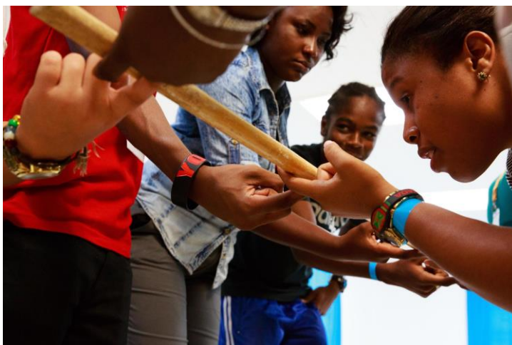
Jóvenes en las Antillas aprenden juntos sobre la Iglesia y la Transformación de la Comunidad

Un discípulo también aprende a hacer las cosas que hizo Jesús. Jesús empezó mostrándole a sus discípulos cómo hacer las cosas, luego dejándoles hacerlas con su ayuda, y finalmente dejándoles hacerlas solos. Un discípulo hoy ejerce los dones de la sanidad, en poder y servicio, muestra amor a los desamparados, cruza los límites sociales, y predica las buenas nuevas a los pobres.