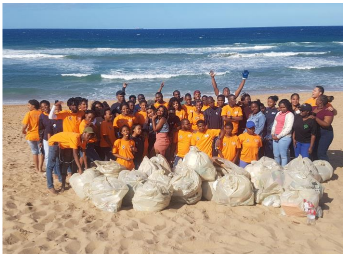
Anglicanos Verdes limpian playas en el sur de África

5) Los discípulos ATESORAN: Nos esforzamos por resguardar la integridad de la creación y por sostener y renovar la vida de la tierra.