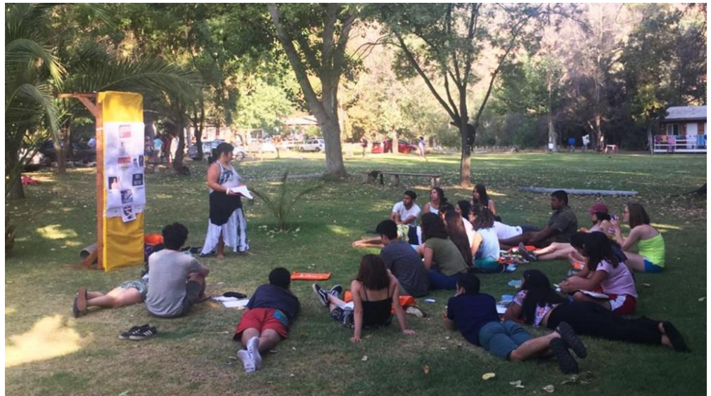
Un campamento de discipulado de jóvenes en Santiago, Chile

Hoy los discípulos están llamados también a seguir el camino de Cristo, centrados en él y aprendiendo de él y de los que están dispuestos a acompañar y mentorearlos. San Pablo, que describió esta relación como de padre/hijo (I Cor 4.16), dijo “Imítenme a mí, como yo imito a Cristo.” (I Cor. 11.1)