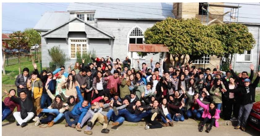
Un congreso de jóvenes en Chol Chol, Chile, Nov. 2018

En Chile, un enfoque centrado en la misión, el discipulado y el liderazgo llevó, según lo informado, a un crecimiento del 30% en la iglesia desde el año 2000. Los clérigos y líderes laicos buscan activamente a los jóvenes, mentoreándolos y ofreciéndoles un programa de acompañamiento de un año con un párroco.