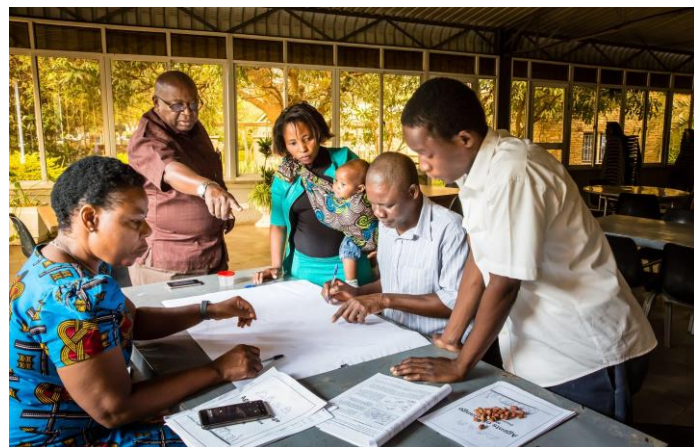
Taller de Agentes de Cambio en Lusaka, Sept. 2017