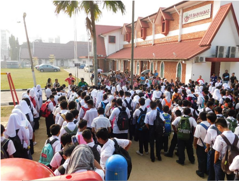
Alumnos de Rohingya en la escuela San Bernabé

Varias iglesias de ciudad en Kuala Lumpur están trabajando para escolarizar a niños refugiados de Myanmar.