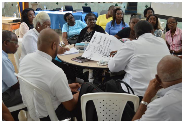
Consulta sobre Discipulado de Vida Entera, Jamaica, 2017

Luego de una Consulta en Jamaica sobre el discipulado de la vida entera, el Obispo Howard Gregory comentó, 'Nunca vi tanto entusiasmo y energía en una reunión de la Iglesia. Hombres y mujeres, niños y jóvenes en todas las parroquias están siendo capacitados para ayudarles a vivir una vida moldeada por Jesús.'