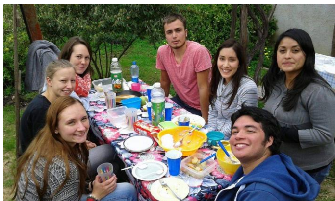
Disfrutando de la vida juntos en Sudamérica

Deberíamos preguntar “¿Cómo es un padre/madre moldeado por Jesús?” o bien “¿Cómo es un empleador moldeado por Jesús?” Al mismo tiempo, un discípulo puede traer nueva esperanza a los que están buscando esta nueva vida. Seguir a Jesús debe tocar nuestras actitudes hacia el trabajo, las relaciones y la cultura.